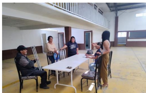
Visita y afiliación en la comunidad de irolo