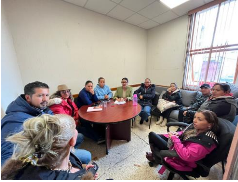
Mesa de trabajo de la Comisión de Hacienda – 23 de junio de 2025 Sesión para revisar y analizar asuntos financieros del municipio, asegurando un manejo responsable y transparente de los recursos públicos.