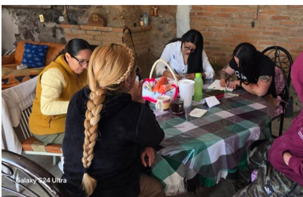
Visita y afiliación del programa Tepea Bienestar para la comunidad de coyotes