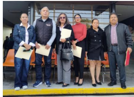
Entrega de apoyo económico a banda de la Secundaria Técnica 26