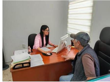
Reunión con integrantes del mercado de Ciudad Sahagún, invitando a la rectificación de la mesa directiva.