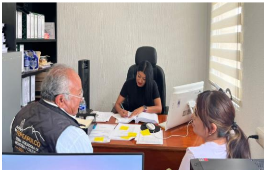
Atención a la solicitud de vecinos de Cd. Sahagún