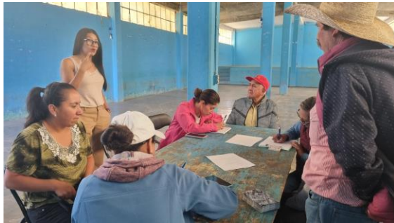
Visita y afiliación del programa Tepea Bienestar para la comunidad de Corralillos

En cumplimiento con el compromiso de cercanía con la ciudadanía, se llevaron a cabo diversas audiencias públicas y reuniones de atención ciudadana, escuchando a inversionistas, locatarios, deportistas y vecinos para dar seguimiento a sus gestiones.