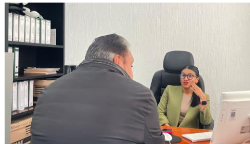
Reunión con integrantes del mercado de Ciudad Sahagún

Encuentro con representantes del mercado para dialogar sobre sus necesidades y extender la invitación a participar en la rectificación de la mesa de trabajo correspondiente.