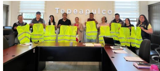
Entrega de chalecos al área de mercado