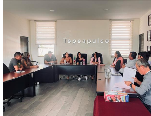
Reunión con líderes deportivos celebrada el 09 de abril de 2025, en la cual se abordaron las condiciones actuales de las disciplinas deportivas en el municipio y se discutieron propuestas para mejorar los espacios, apoyos y oportunidades de los atletas locales.