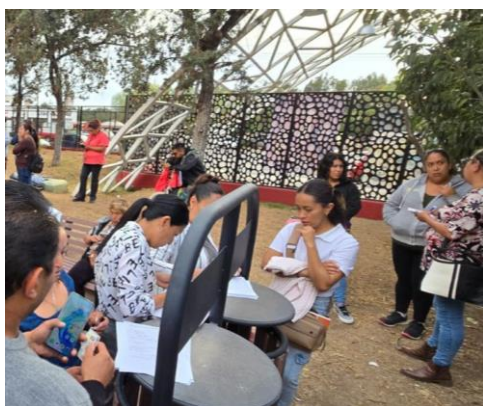
Atención ciudadana para las necesidades de la Banda Castores y afiliación al programa Tepea Bienestar