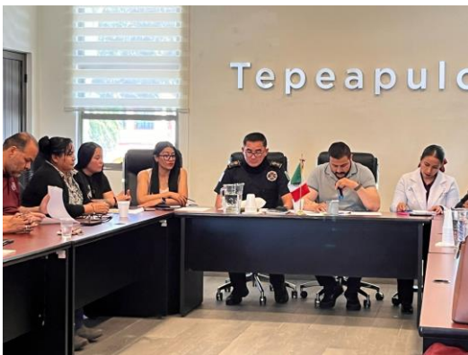
Mesa de trabajo sobre contingencia por incendio – 14 de marzo de 2025 Nos reunimos para dar respuesta inmediata a la emergencia del incendio y coordinar apoyos en beneficio de las familias afectadas.