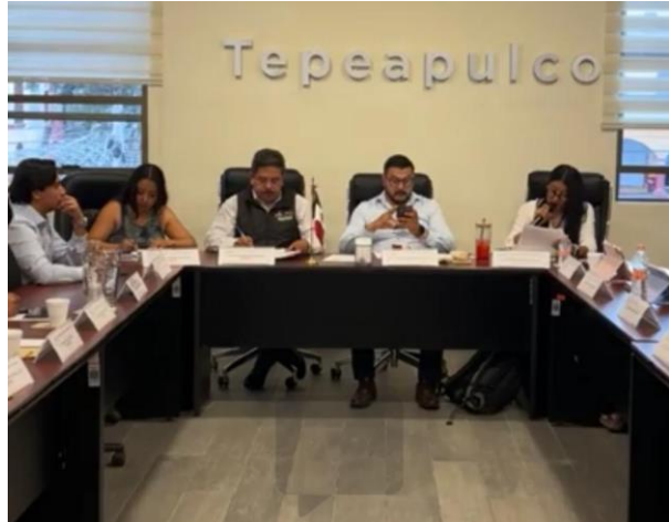
Sesión Ordinaria de Ayuntamiento