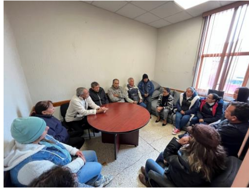
Mesa de trabajo con vecinos de la colonia 21 de Julio – 24 de junio de 2025 Escuchamos a la comunidad y compartimos información sobre el manejo de recursos, trabajando juntos para atender sus necesidades