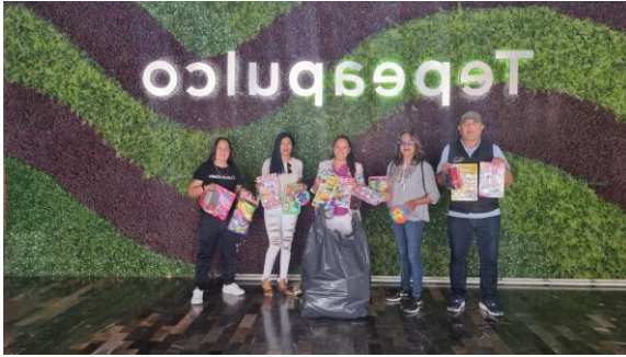
Donación de juguetes al Sistema DIF Se atendió la petición del Sistema DIF Municipal mediante la donación de juguetes, en apoyo a sus programas de atención a la niñez.