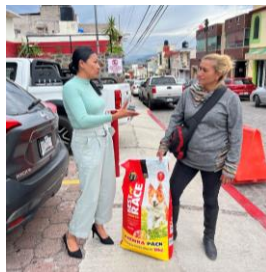
Entrega de croquetas a refugio de perros Se realizó la entrega de croquetas en apoyo a un refugio de perros, reforzando las acciones de bienestar y protección animal en el municipio.