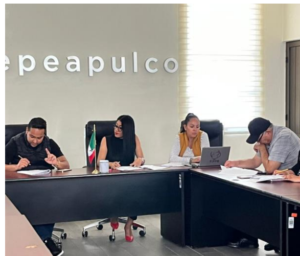
Mesa de trabajo celebrada el 05 de junio de 2025, para la elaboración de la Iniciativa del Reglamento del Código de Conducta, estableciendo lineamientos claros para el comportamiento de los servidores públicos y la consolidación de una administración municipal responsable.