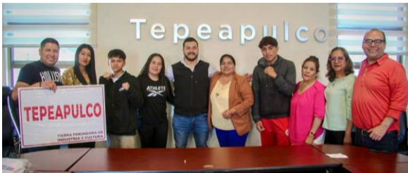
Gestión de apoyos para deportistas