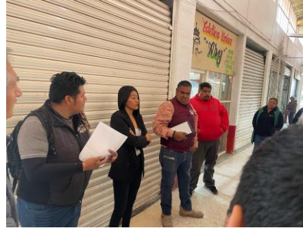
Reunión con integrantes del mercado de Ciudad Sahagún, invitando a la rectificación de la mesa directiva (9 de mayo de 2025).