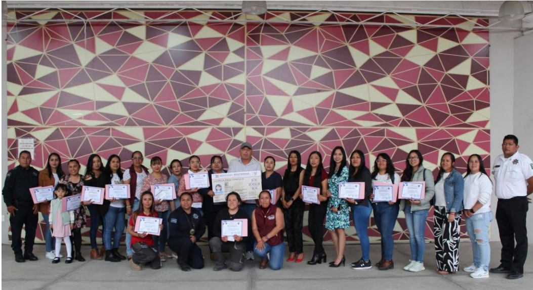
Clausura del curso de manejo dirigido a mujeres – 07 de abril de 2025 Entrega de reconocimientos a mujeres egresadas del curso de manejo, iniciativa orientada a fomentar la autonomía, independencia y seguridad en la movilidad de las participantes.