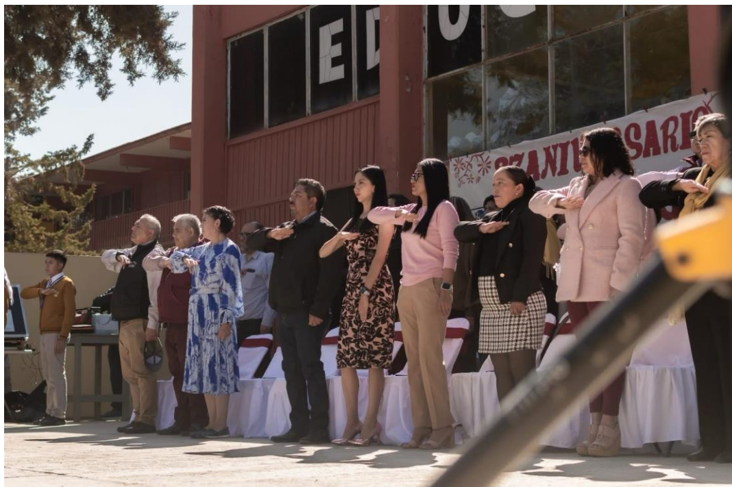
Participación en la ceremonia cívica conmemorativa de la expropiación petrolera: fortaleciendo los valores patrióticos y fomentando el respeto a la historia nacional en la comunidad estudiantil.