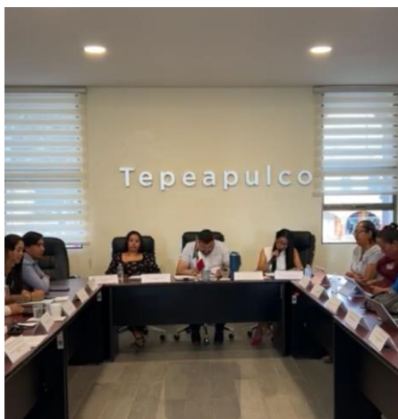
Sesión Ordinaria de Ayuntamiento

En apego a la Ley Orgánica Municipal del Estado de Hidalgo y al Reglamento Interior del Ayuntamiento de Tepeapulco , se participó en sesiones ordinarias y extraordinarias, cumpliendo con las funciones de Síndica Hacendaria en el análisis y aprobación de asuntos municipales.