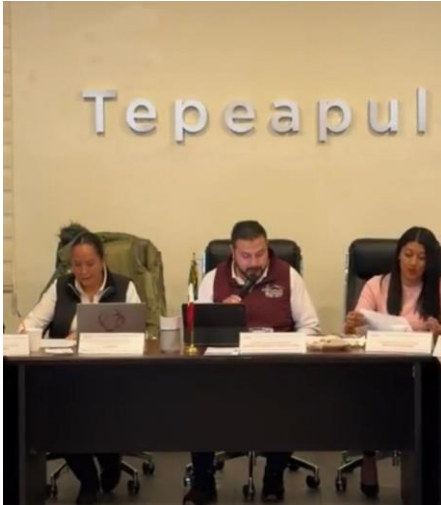
Sesión Ordinaria de Ayuntamiento