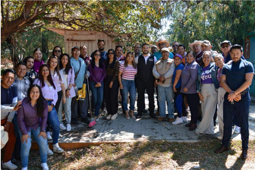
Faena de limpieza, en recuperación de espacios públicos verdes: Jornada comunitaria de limpieza y rescate de áreas verdes, promoviendo la participación ciudadana en la conservación