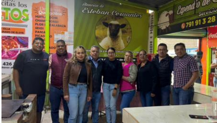
Reunión con integrantes del mercado de Ciudad Sahagún, invitando a la rectificación de la mesa directiva (9 de mayo de 2025).

Se realizaron visitas al mercado municipal y locales comerciales, sosteniendo diálogo directo con locatarios y representantes para atender sus necesidades y fortalecer la economía local.