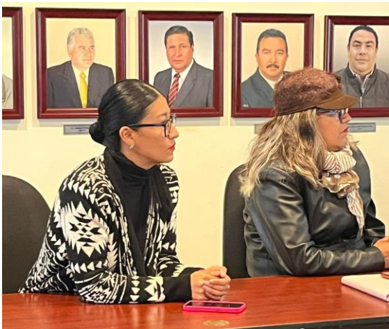
Mesa de trabajo donde se analiza y discute la Iniciativa del Código de Ética del Ayuntamiento de Tepeapulco, celebrada el 24 de junio de 2025, con la finalidad de fortalecer la transparencia, la rendición de cuentas y la integridad en el servicio público.

En el marco de las atribuciones conferidas por la Ley Orgánica Municipal del Estado de Hidalgo y el Reglamento Interior del Ayuntamiento de Tepeapulco, se llevaron a cabo diversas mesas y reuniones de trabajo de comisiones, con la finalidad de analizar, discutir y dar seguimiento a iniciativas, reglamentos, programas y solicitudes ciudadanas.