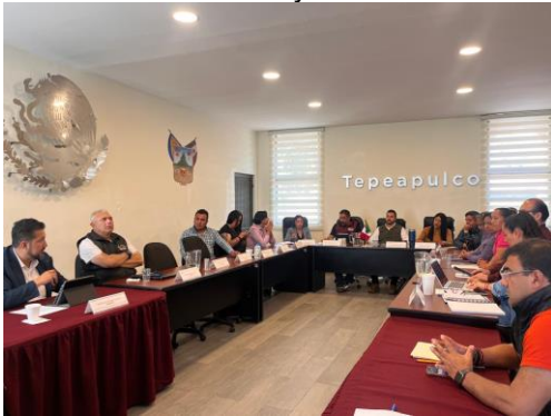
Sesión Extraordinaria de Ayuntamiento