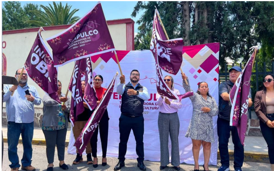
Campañas de bacheo permanente en Ciudad Sahagún – 09 de junio de 2025 Supervisión de las campañas de bacheo permanente en la zona urbana de Ciudad Sahagún, garantizando mejores condiciones de movilidad y seguridad vial para los ciudadanos.