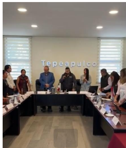
Sesión Extraordinaria de Ayuntamiento