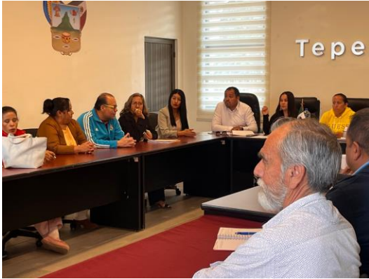
Mesa de trabajo con deportistas del municipio – 13 de febrero de 2025 Reunión en la que se escucharon propuestas y necesidades de deportistas locales, con el objetivo de impulsar el desarrollo deportivo y fortalecer las disciplinas en el municipio.