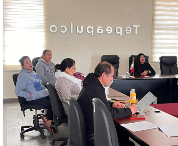
Sesión del 22 de marzo de 2025 en la cual se revisa y analiza la Gaceta Municipal de Tepeapulco, como parte de las acciones de transparencia y acceso a la información pública, garantizando que la ciudadanía conozca los acuerdos y disposiciones emitidas por el cabildo.