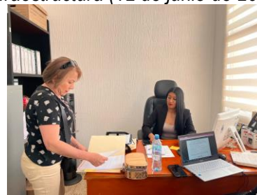
Audiencia ciudadana para dar atención a solicitudes sobre expedientes y procesos administrativos (20 de marzo de 2025).