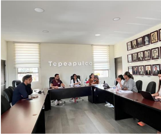
Mesa de trabajo realizada el 20 de mayo de 2025, enfocada en la revisión del Reglamento de Deportes municipal, estableciendo lineamientos para el fortalecimiento de la cultura física, la recreación y el deporte en Tepeapulco.