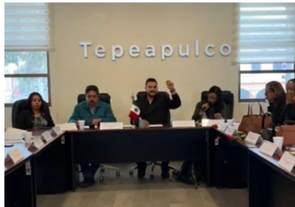
Sesión Extraordinaria de Ayuntamiento