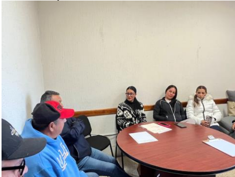
Mesa de trabajo con vecinos de Valle de Guadalupe. 24 de junio de 2025 Dialogamos con los vecinos para escuchar sus necesidades y trabajar juntos en el uso responsable de los recursos públicos.