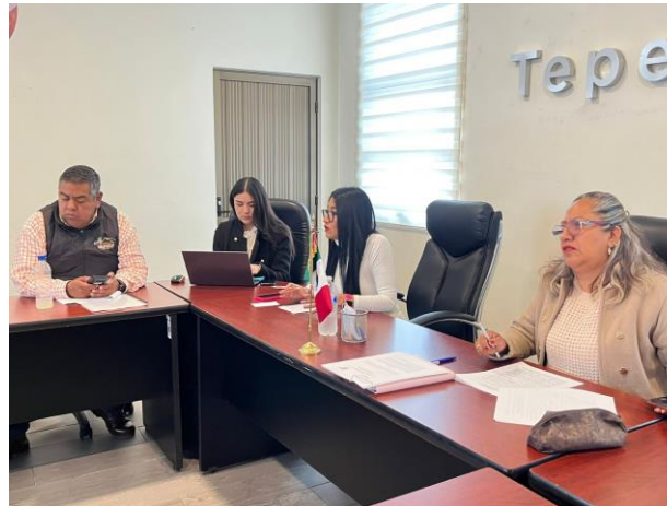
Reunión celebrada el 17 de junio de 2025 para discutir la iniciativa de reglamentos vinculados a espectáculos y mercados, con el fin de garantizar actividades seguras, reguladas y en beneficio de la ciudadanía.