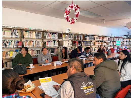
Impulsamos la voz de las y los jóvenes, preparando juntos el proceso para elegir al Cabildo Juvenil y fortalecer su participación en la vida pública del municipio.