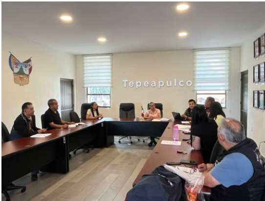
Mesa de trabajo llevada a cabo el 10 de junio de 2025, con el propósito de analizar la iniciativa de reglamentos relacionados con el funcionamiento de los mercados municipales, buscando mejorar la organización, la seguridad y el orden en dichos espacios públicos.