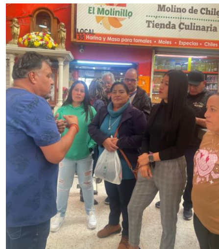
Reunión con integrantes del mercado de Ciudad Sahagún, invitando a la rectificación de la mesa directiva (9 de mayo de 2025).