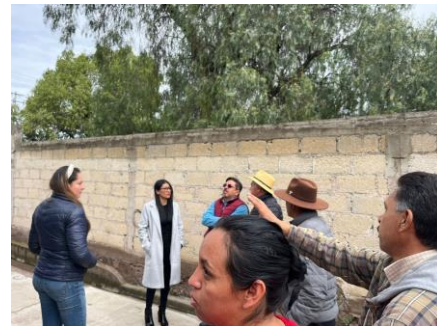
Audiencia pública en colonias del municipio de Tepeapulco.