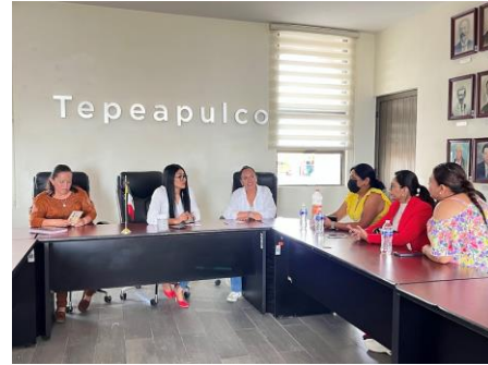
Conversamos con mujeres que impulsan el cambio en nuestra comunidad, reconociendo su liderazgo y trabajando juntas por un municipio más justo e inclusivo.