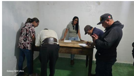
Afiliación en la localidad