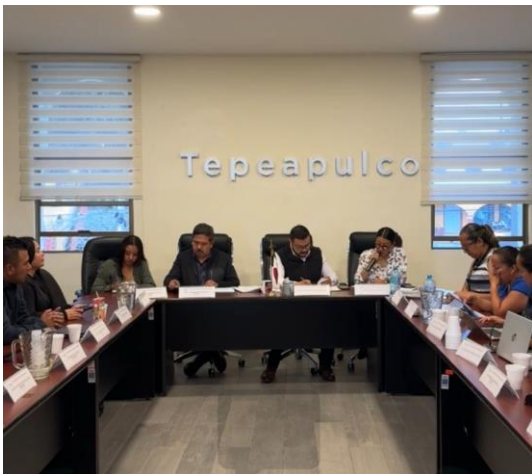
Sesión Extraordinaria de Ayuntamiento