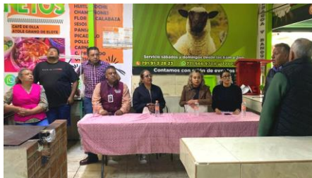
Reunión con integrantes del mercado de Ciudad Sahagún, invitando a la rectificación de la mesa directiva (9 de mayo de 2025).