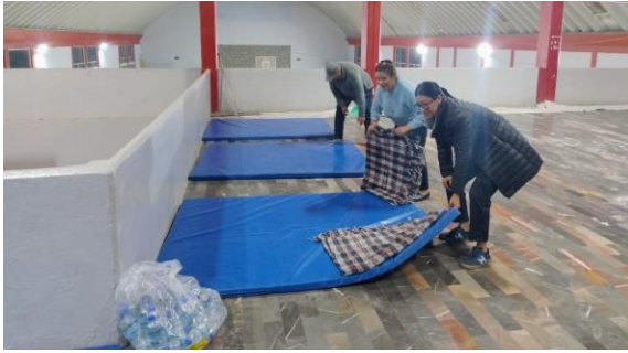
Apoyo para la instalación de albergue temporal por contingencia ambiental Se brindó apoyo para habilitar un albergue temporal, con el fin de proteger y atender a la población afectada por la contingencia ambiental.