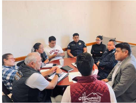
Mesa de trabajo del Comité de Seguridad - 14 de abril de 2025 Reunión en la que se revisaron solicitudes relacionadas con aumento de sueldos y dotación de uniformes para personal de seguridad, con el fin de fortalecer sus condiciones laborales y operativas.