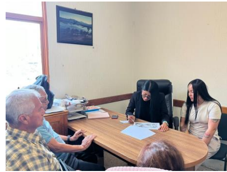
Reunión con habitantes de la colonia Hidalgo para dar seguimiento a sus solicitudes de infraestructura (12 de junio de 2025)