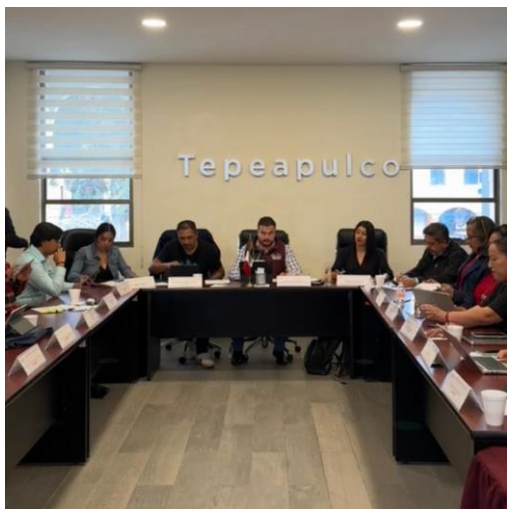
Sesión Extraordinaria de Ayuntamiento