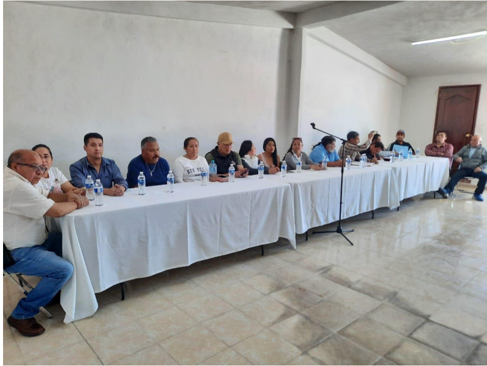
Cambio de la mesa directiva del tianguis de los días sábados en representación del Presidente Municipal – 11 de abril de 2025 Asistencia en la renovación de la mesa directiva del tianguis, representando al Presidente Municipal, fortaleciendo la organización de los comerciantes y la vida económica local.