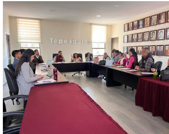
Mesa de trabajo sobre el Código de Ética – 17 de febrero de 2025 Sesión dedicada al análisis del Código de Ética para fortalecer la transparencia, la integridad y el compromiso de las y los servidores públicos con la ciudadanía