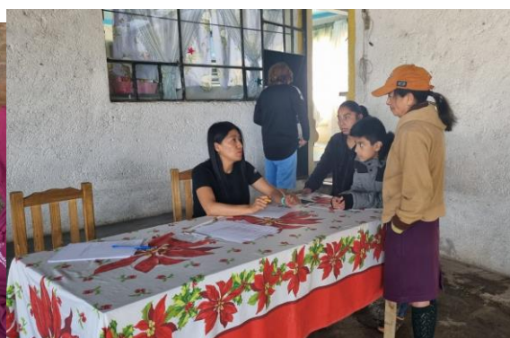
Visita en la comunidad de los cides para afiliar al programa tepea bienestar