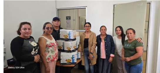
Entrega de regalos al Sindicato de Trabajadores del Municipio de Tepeapulco Con motivo de su aniversario, se realizó la entrega de obsequios al Sindicato de Trabajadores del Municipio, reconociendo su labor y compromiso en el servicio público.