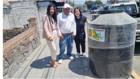
Apoyo con tinaco de agua en Tultengo Se otorgó un tinaco de agua para los baños del campo deportivo de la comunidad de Tultengo, fortaleciendo la infraestructura y el servicio a la población usuaria.