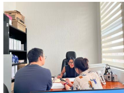
Reunión con inversionistas – 26 de mayo de 2025 Encuentro con inversionistas para escuchar propuestas de desarrollo económico, orientadas a impulsar el crecimiento y la competitividad del municipio.