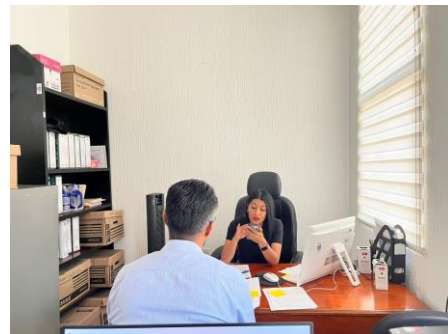
Reunión con el vecino de la Col. Rojo Gómez con la solicitud de limpieza de áreas verdes