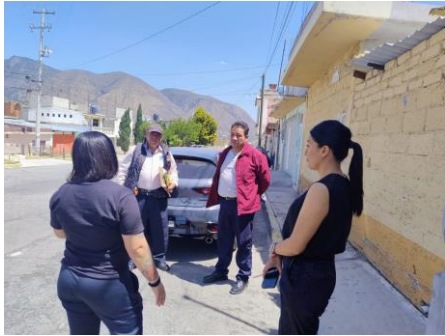
Reunión con habitantes de la colonia Hidalgo para dar seguimiento a sus solicitudes de infraestructura (12 de junio de 2025).