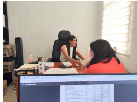
Atención a ciudadana