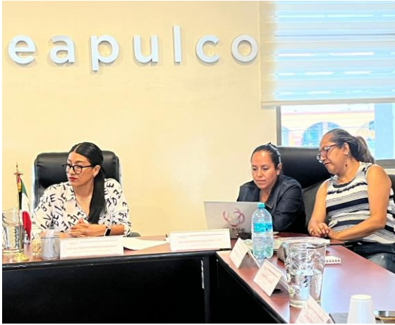
Sesión de lectura y revisión del Reglamento de Deportes del municipio, llevada a cabo el 23 de mayo de 2025, con el objetivo de analizar su aplicación y reforzar el impulso a las actividades deportivas como parte de la vida comunitaria.