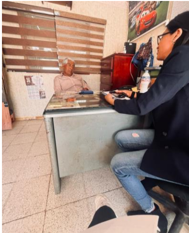
Diálogo con locatarios de Paseo de Fray Toribio de Benavente (31 de marzo de 2025).