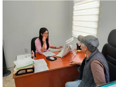
Reunión con integrantes del mercado para verificar los bienes inmuebles municipales