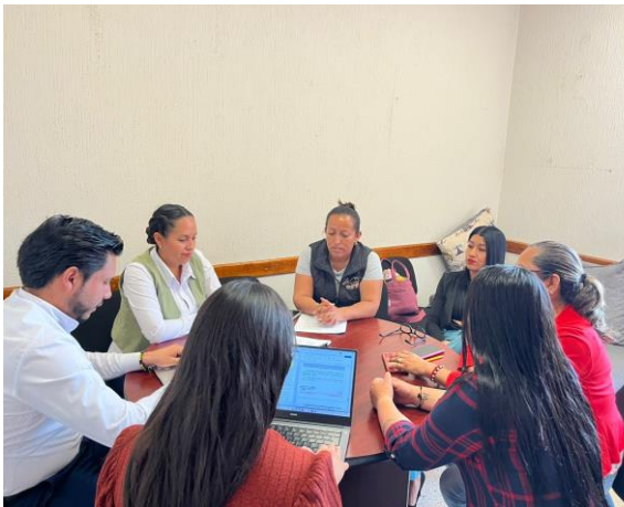
Mesa de trabajo celebrada el 30 de mayo de 2025 para la lectura y análisis del Reglamento de Deporte, con la finalidad de reforzar la promoción deportiva y garantizar la inclusión de todos los sectores sociales.