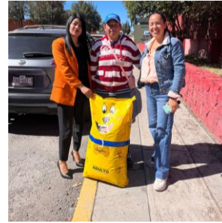
Entrega de croquetas en apoyo a la protección y bienestar animal, reafirmando el compromiso del municipio con el cuidado responsable de los animales.