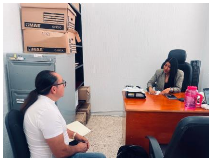
Reunión con integrantes del mercado de Ciudad Sahagún, invitando a la rectificación de la mesa directiva (9 de mayo de 2025)