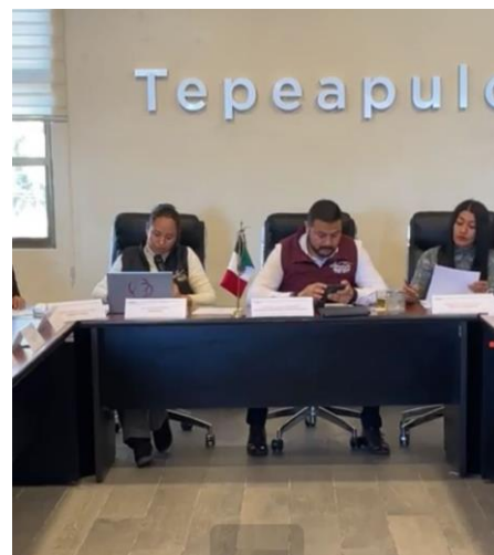
Sesión Ordinaria de Ayuntamiento