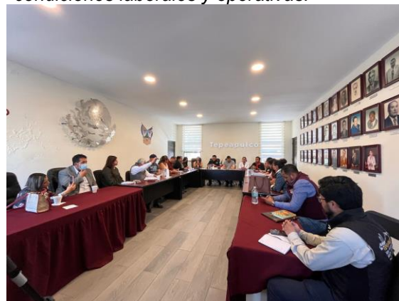
Reunión de seguimiento para evaluar avances en la atención de la contingencia ocasionada por el incendio y reforzar las acciones de apoyo a la población afectada.