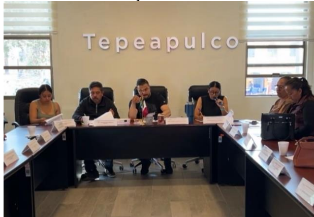
Sesión Extraordinaria de Ayuntamiento