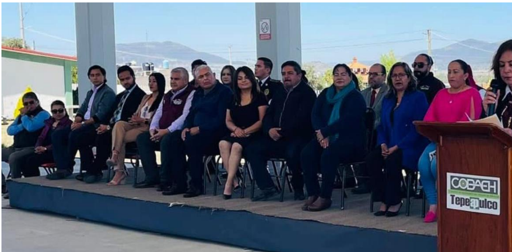
Commemoración del Día de la Bandera en el COBAEH – 24 de febrero de 2025 Acto cívico en honor a la Bandera Nacional, reafirmando los valores de unidad, identidad y respeto a los símbolos patrios en el ámbito educativo y social.