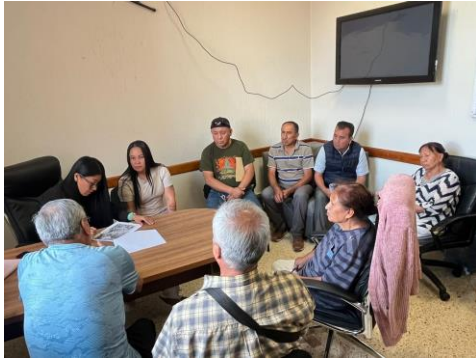
Reunión con habitantes de la colonia Hidalgo – 12 de junio de 2025: Encuentro para dar seguimiento a solicitudes de infraestructura, revisando proyectos y acciones prioritarias que atiendan las necesidades de la Colonia