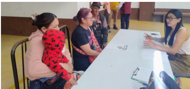
Visita y afiliación en la comunidad de irolo

Se realizaron múltiples jornadas de afiliación al programa Tepeapulco Bienestar en colonias y comunidades, acercando los apoyos sociales de manera directa a la ciudadanía.