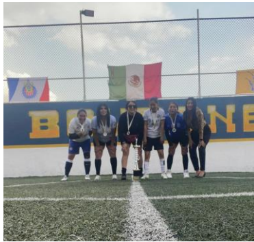
Se entregaron trofeos a equipos de fútbol de la Bombonera como reconocimiento a su esfuerzo y para fomentar la práctica deportiva en el municipio.